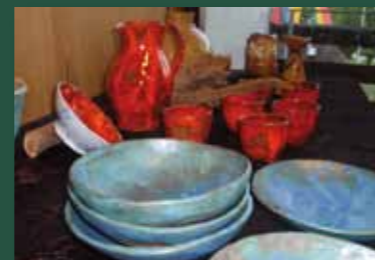
Produkte der Keramikgruppe

Der Förderverein unterstützt die Betreuungseinrichtung in ideeller und finanzieller Hinsicht: Zum einen sind wir bestrebt, durch entsprechende Öffentlichkeitsarbeit das Ansehen von Menschen mit geistiger Behinderung positiv zu beeinflussen. Die Bevölkerung aber auch Verantwortungsträger des öffentlichen gesellschaftlichen Lebens (insbesondere aus Politik, Wirtschaft, Kultur und Religion) sollen für die Solidarisierung mit Anliegen behinderter Menschen gewonnen werden.