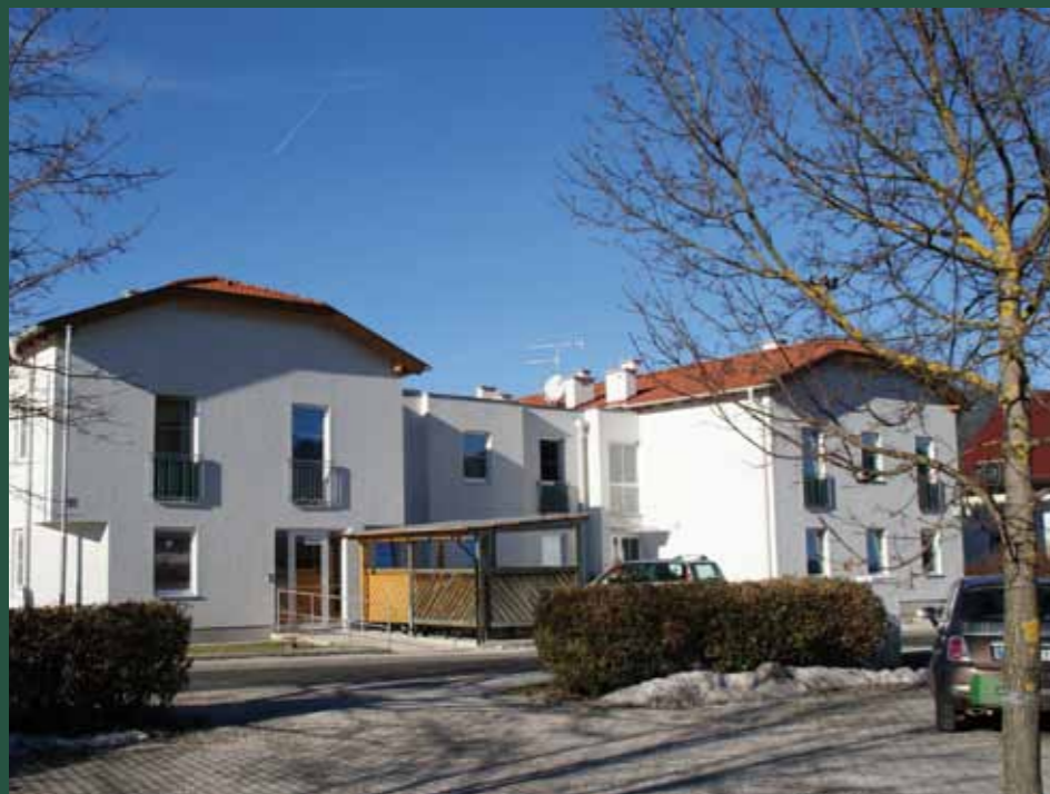
Die Wohngruppe 1 im Sozialzentrum Neusiedl