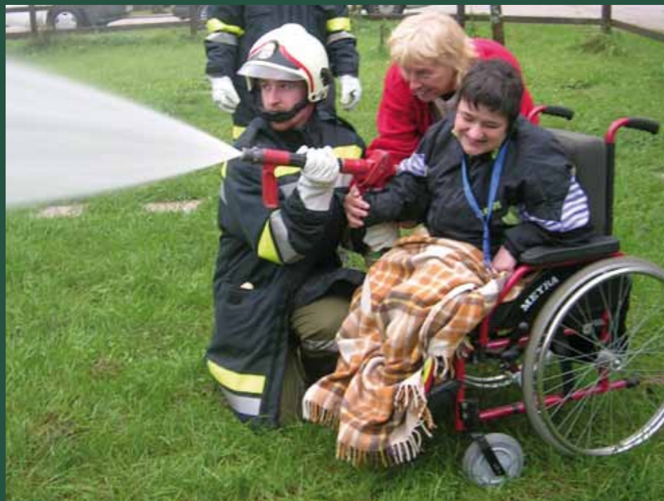
Übung der Feuerwehr Pernitz