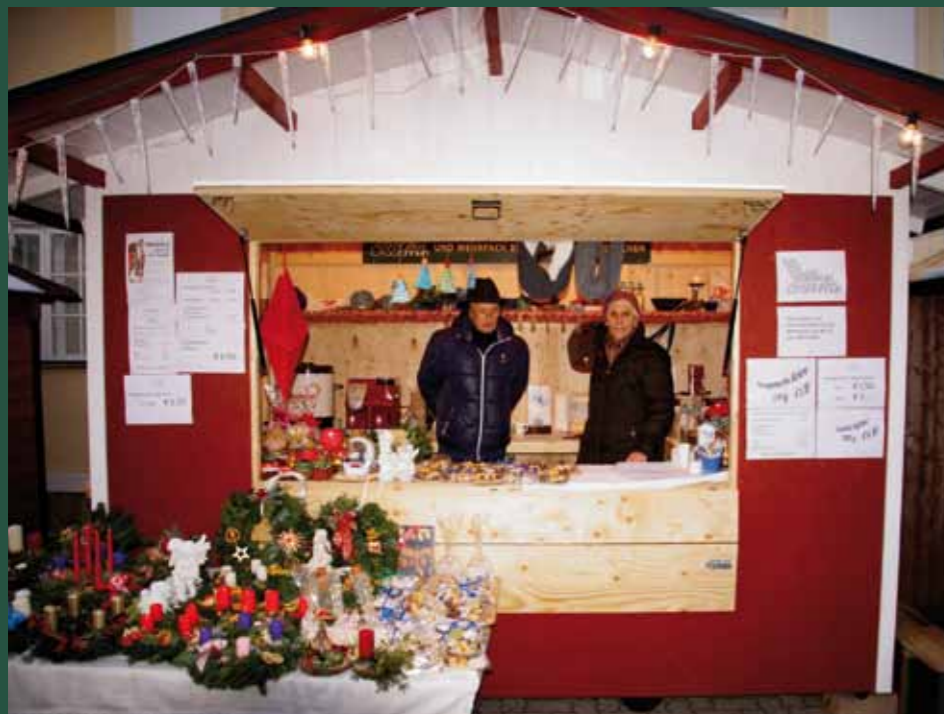
Adventmarkt in Pernitz