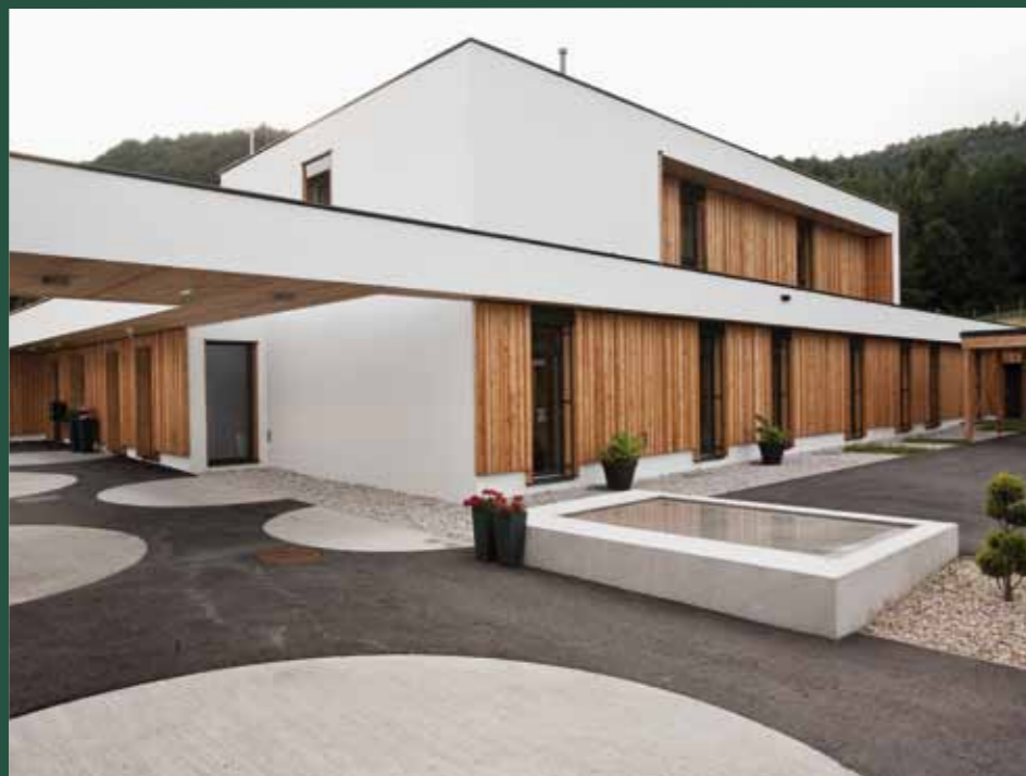
Die Wohngruppe 2 in Pernitz