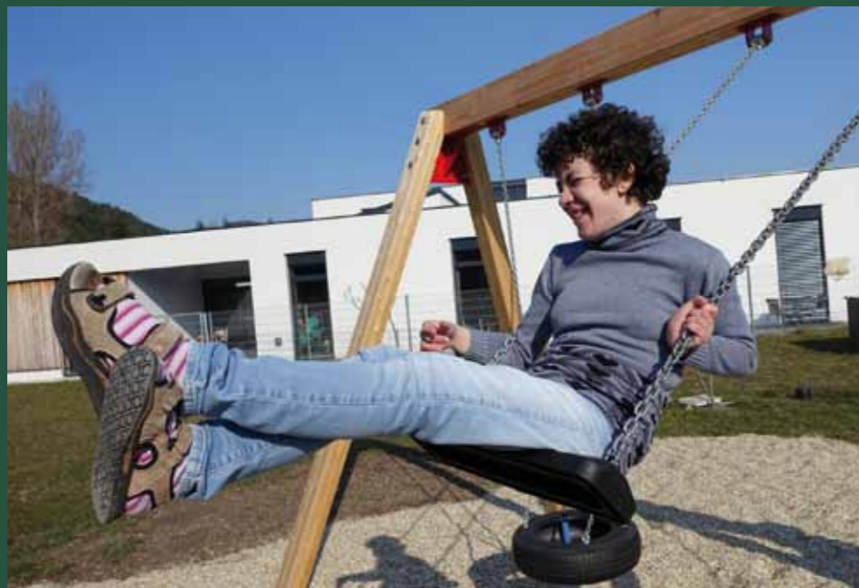
Schaukeln im Garten der Tagesbetreuung