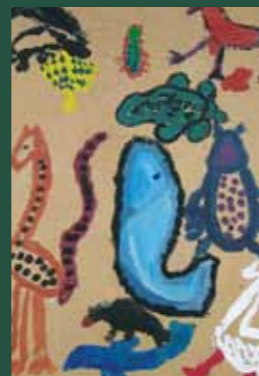
»Besuch im Tierreich« Ferdinand Schachelhuber

In der Tagesbetreuungsstätte werden Beschäftigungsmöglichkeiten für behinderte Menschen mit unterschiedlichsten Fähigkeiten, Bedürfnissen und Interessen angeboten: