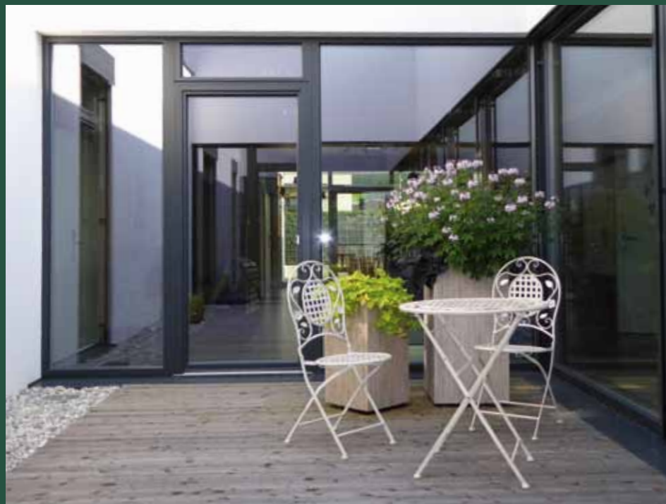
Atriumhof der Tagesbetreuung